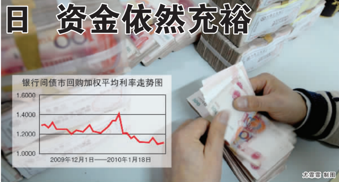
银行间市场回购加权平均利率走势图 2009年12月1日—2010年1月18日 尤韞韞 制图

但是从央行昨日发布的央票发行通知来看, 今日的发行规模为 240 亿元, 较上周增加 40 亿元, 本周到期资金量较上周增加 420 亿元 2500 亿元。从发行量上难以判断最终利率可能出现的变化, 但资金面宽松状态近期将延续, 则没有太大悬念。